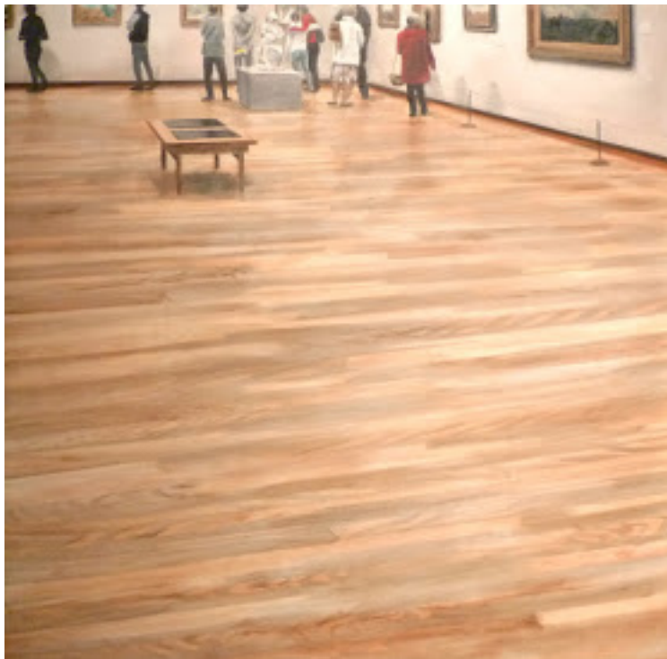
Schilderijen van Plinio Avila

P.S.: Daan Rau schreef zopas in het juninummer van 'Openbaar Kunstbezit in Vlaanderen' een mooi artikel omtrent Colin Waeghe en zijn werk.