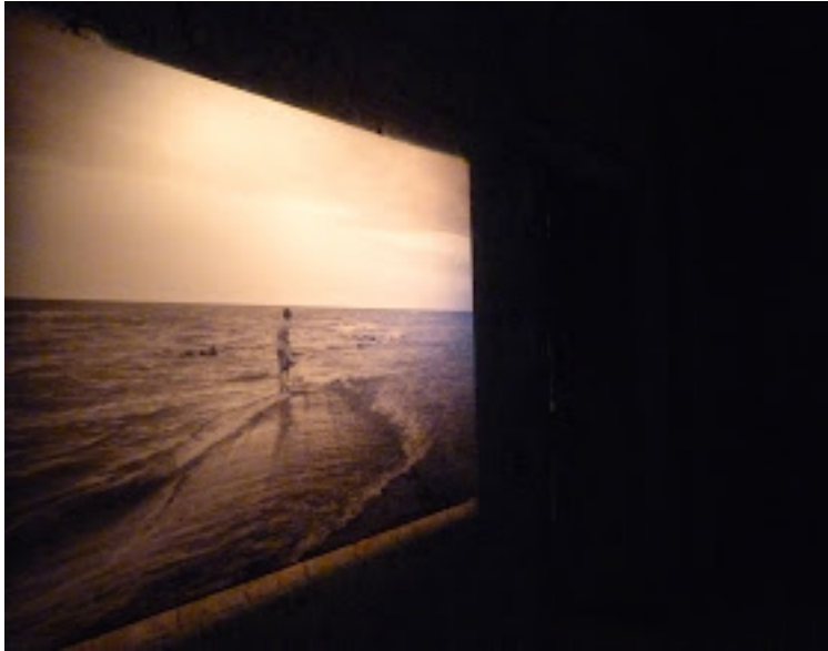
Fotografie en verstilde video van Kurt Stallaert

Ook de invalshoek van Plinio AVILA zorgt voor een wel heel aparte ervaring. Hij concentreert zich in zijn schilderijen op de vloeren van museumzalen en de al dan niet in beeld gebrachte werken en bezoekers. Hij creëert de perfecte mix tussen intimiteit en afstandelijkheid in de manier waarop hij de parketvloeren en de omringende details met gevatte toetsen neerzet.